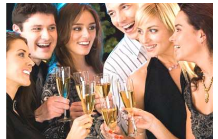
GESTION DES CLIENTS