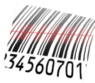
MAITRISE DES STOCKS